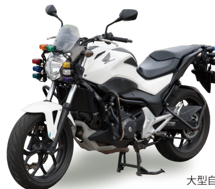
大型自動二輪教習車