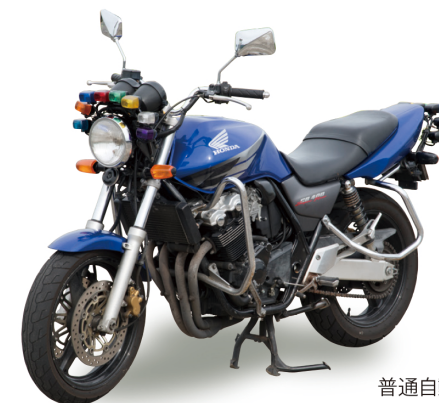
普通自動二輪教習車